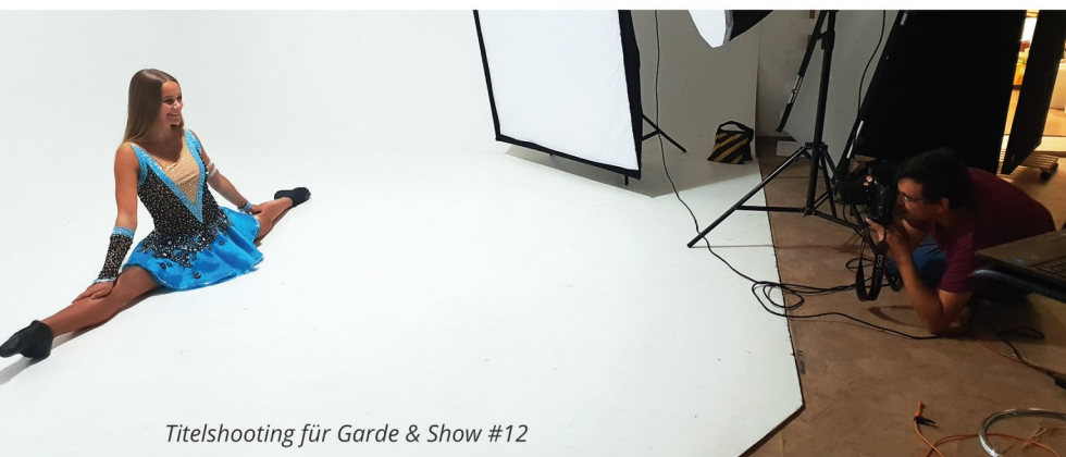
Titelshooting für Garde & Show #12

Haftungsausschluss: Alle Angaben im Magazin sind ohne Gewähr und erheben keinen Anspruch auf Vollständigkeit. Die Nutzung der Übungen und Tipps erfolgt auf eigene Gefahr und ist auf gesunde Sportler ausgelegt. Falsche oder unachtsam ausgeführte Übungen können Auswirkungen auf die Gesundheit haben. Es besteht kein Haftungsanspruch gegenüber der Tino Geist & Katharina Melzer GbR (Garde & Show) und der Autoren. Die Tino Geist & Katharina Melzer GbR entbindet sich jeglicher Haftung für Schäden oder daraus resultierender Folgen und übernimmt keine Kosten dafür.