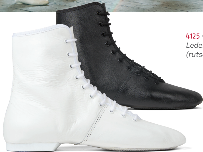
4125 Gardestiefel HIT II Leder, geteilte Gummisohle (rutschfest)