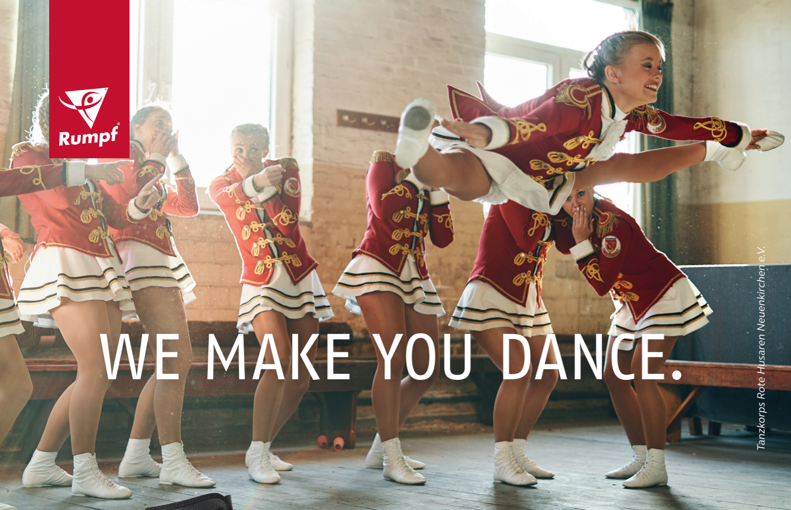
Tanzkorps Rote Husaren Neuenkirchen e.V.